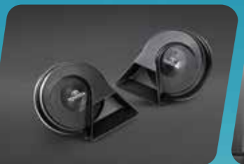
CỒI XE CAO CẤP