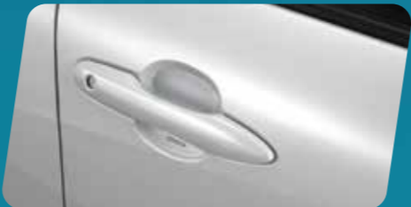
ỐP HỖM TAY VÂN CACBON (MÀU BẠC)