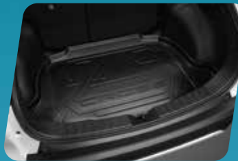
KHAY HÀNH LÝ