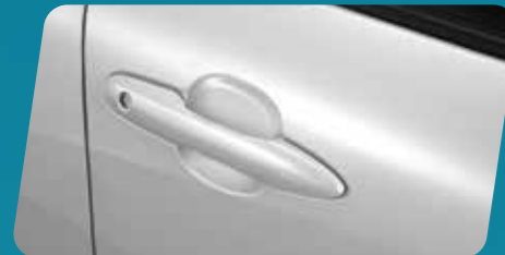
PHIM DÁN BẢO VỆ HỖM TAY NẮM CỬA