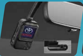
CAMERA HÀNH TRÌNH (GEN2)