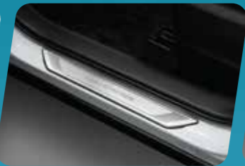
ỐP BẠC LÊN XUỐNG 4 CỬA