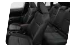
NỘI THẤT ĐEN