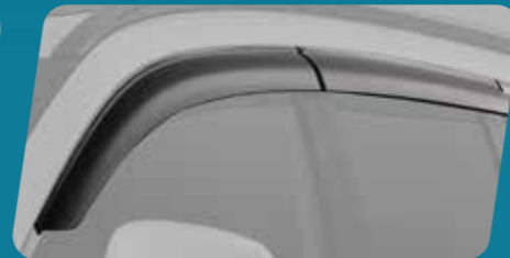
VỀ CHE MƯA