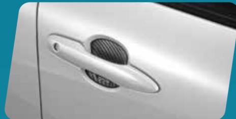
ỐP HỖM TAY VÂN CACBON (CAO SU)