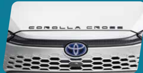
BIỂU TƯỢNG CHỮ COROLLA CROSS