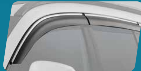
VỀ CHE MƯA (MÀ CRÔM)