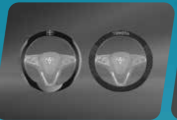
BỌC VÔ LÃNG