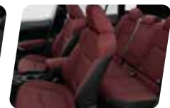
NỘI THẤT ĐỎ ĐẬM