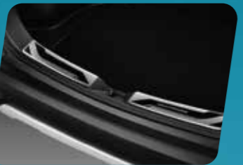
ỐP CHỐNG TRẦY CỘP SAU