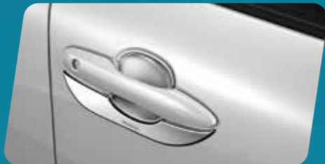
ỐP HỖM TAY NẮM CỬA (MÀ CRÔM)