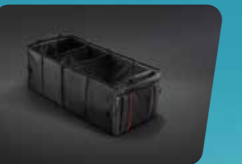
KHAY HÀNH LÝ GẤP GỌN