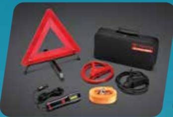
BỘ HỖ TRỢ KHẨN CẤP