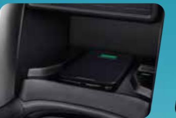
SẠC KHÔNG DÂY