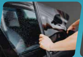
PHIM DÁN KÍNH