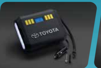
BƠM LỚP ĐIỆN TỬ